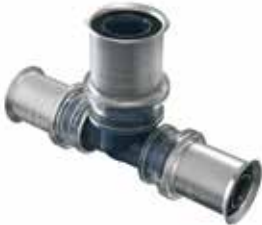
Tigris K5 -puristus T-haarat