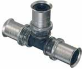
Tigris K5 -puristus T-haarat