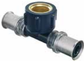
Tigris K5 -T-haarat sk