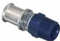
Tigris K5 -puristusliittimet uk