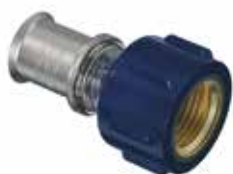
Tigris K5 -puristusliittimet sk