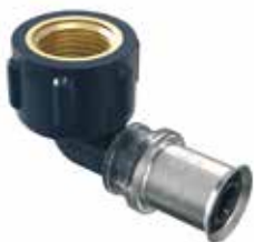
Tigris K5 -puristuskulmat sk