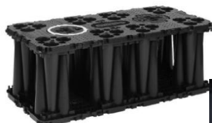
Figure 3 Extra strong configuration