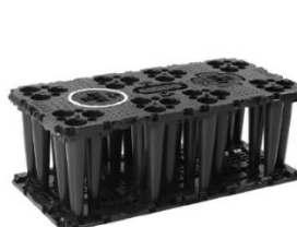
Figure 2 Regular configuration