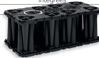
Installation extra-résistante (unités emboîtées)

Remarque : Wavin ne saurait être tenue responsable si les produits décrits dans le présent document sont utilisés d'une manière non conforme à nos exigences, à nos normes ou aux finalités définies dans ces normes. Comme nous nous efforçons constamment d'apporter des améliorations, les informations contenues dans ce document ainsi que les produits présentés peuvent être modifiés sans préavis. Pour consulter la dernière version de ce document, rendez-vous sur www.wavin.com . Veuillez nous contacter si vous avez des questions ou si vous souhaitez obtenir une documentation ou des informations complémentaires. Le présent document n'a aucun caractère contractuel et n'a pas de valeur juridique contraignante.